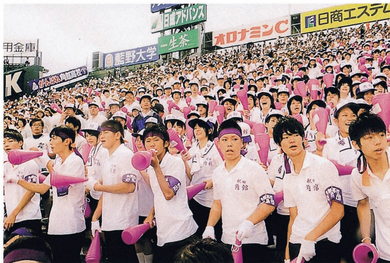
甲子園で熱心に元気よく母校を応援する生徒と同窓生